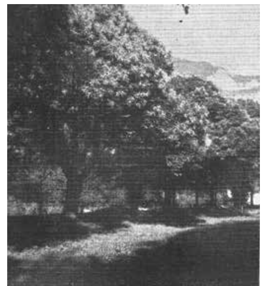
Die zahme Kastanie als Alleebaum in Walenstadt an der Seestrasse.