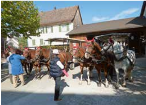
Kutschen in Hallau

Wie jedes Jahr Anfang Oktober machte sich eine grosse Zahl von Mitgliedern auf zum alljährlichen Vereinsausflug. Die Reise ging durch den Nebel im Linthgebiet ins sonnige Zürcher Oberland, zum Znünihalt in Illnau, von da weiter über Winterthur und Schaffhausen ins Klettgau nach Oberhallau.