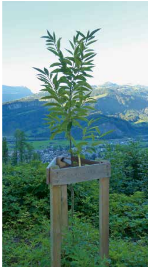
Die frisch gepflanzten Bäume gedeihen gut.

Kenner wissen ja, dass die Edelkastanie nur sehr schlecht auf Kalk gedeiht (siehe Kastan). Laut geologischer Karte befinden sich dort Moränen mit Rheingletschergeschieben, und deshalb ist es gut möglich, dass es lokale Stellen gibt, deren Böden einen leicht tieferen pH-Wert (eher leicht sauer)