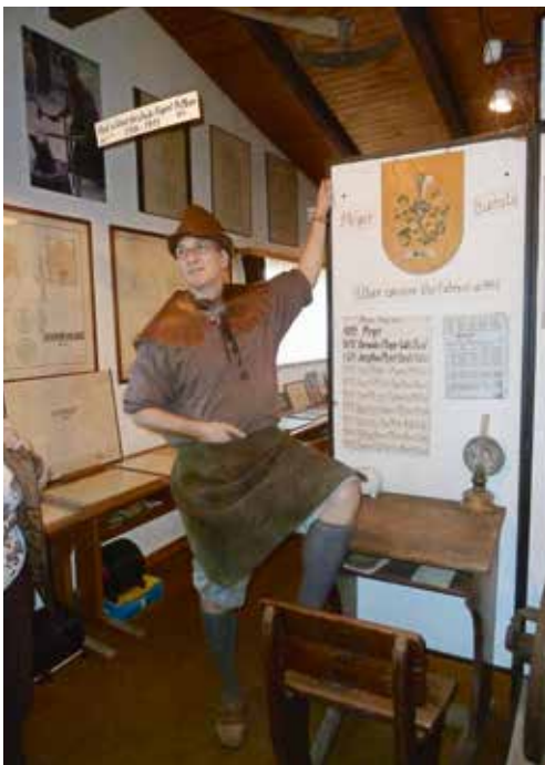
Führer des Museums

Dort wechselte man vom Car auf zwei Kutschen und genoss eine herrlich Fahrt durch die Rebberge von Hallau. Nach dem Mittagessen ging es vom Wein zum Wasser. Leider führte der Rhein eher wenig Wasser, trotzdem war der Rheinfluss sehr imposant. Die Rückfahrt führte über Wil nach Bazenhaid ins Toggenburger Schmiede- und Werkzeugmuseum, wo noch ein Apéro genossen wurde.