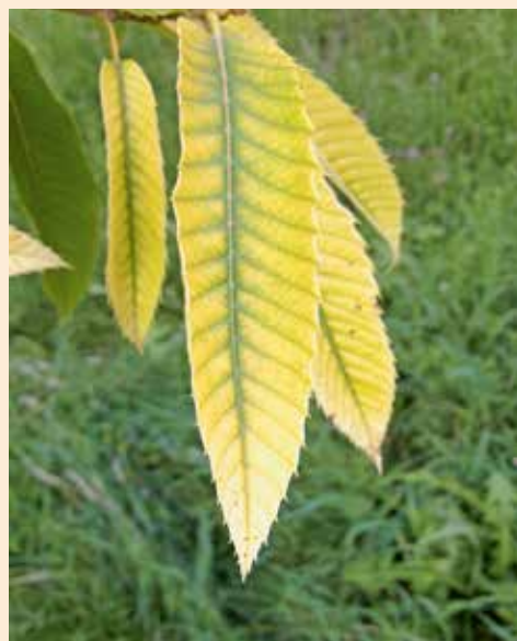
Kastanie auf Kalk

Die Edelkastanie bevorzugt frische, leicht bis stark saure (tiefer pH-Wert) und kalireiche Böden. Der pH-Wert sollte nicht höher als 6.5 sein. Ist der Boden zu kalkig (pH-Wert über 6.5), zeigt sich das im Verfärben der Blätter. Das heisst, die Blätter werden schon früh im Sommer gelb und bleiben aber entlang der Blattnervatur noch lange grün. Die Blätter fallen im Herbst auch recht früh vom Baum.