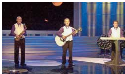
Am Grand Prix der Volksmusik im Jahre 2010 mit dem Titel «Träume in ihren Augen»

Gäste mit ihrer Musik aufs Beste zu unterhalten.