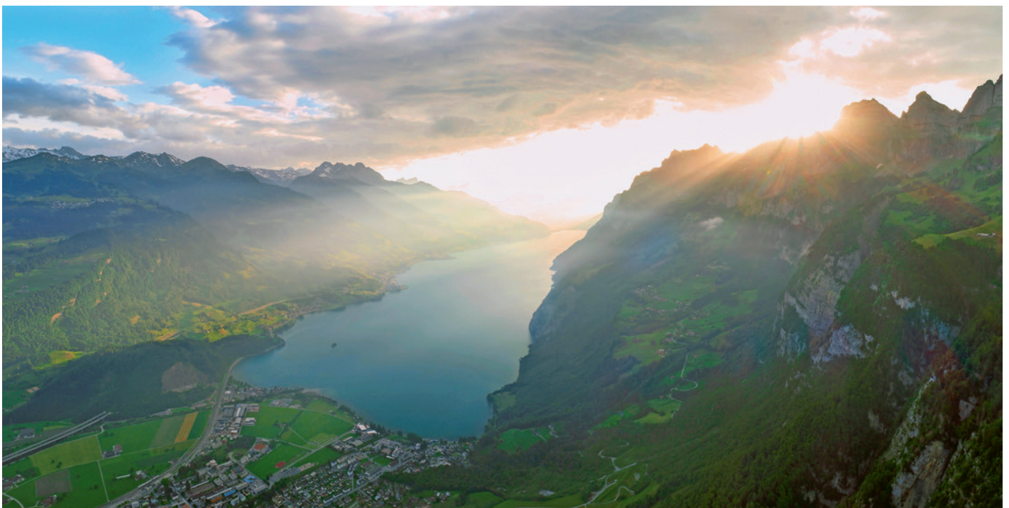
Sommerabend am Walensee