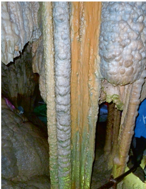
In den einzigartigen Höllgrotten Baar

Vor rund einem Jahr begaben sich die Mitglieder des Vereins Pro Kastanie Murg auf ihre Vereinsreise. Diese führte die Teilnehmer zuerst in die Höllgrotten im Lorzentobel bei Baar, die weltweit einzigartigen Tropfsteinhöhlen. Danach ging es weiter auf die Königin der Berge, die Rigi, einmalig gelegen zwischen Zuger-, Lauerzer- und Vierwaldstättersee.