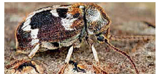
Hedobia regalis (kein deutscher Name)

wird sie immer wichtiger. Die «mediterrane Zuzügerin» kommt mit den steigenden Temperaturen gut zurecht.