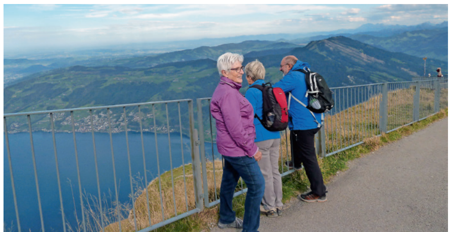
Mitglieder beim Vereinsausflug auf der Rigi

Neben dem offiziellen Jahresprogramm ist in den vergangenen Monaten wieder sehr viel los gewesen in Sachen Edelkastanie. Neben den zahlreichen Führungen, welche durchgeführt wurden, konnte der Präsident auch wieder etliche junge Kastanienbäume vermitteln, welche gesetzt wurden. Auch war seine Beratung und Erfahrung in Sachen Edelkastanie immer wieder gefragt.