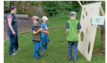
Beim Familientag vom 22. Juni waren alle mit vollem Eifer dabei.

Eine Woche später am 29. Juni fand die Selvenpflege statt, dabei wurden die Kastanienselven ausgemäht und wieder auf Vordermann gebracht, ebenfalls wurde auch beim Spielplatz und beim Cheschtene-stübli das Gras zurückgeschnitten. Eine weitere Selvenpflege fand am 21. September statt.