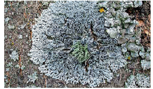
Physica stellaris (kein deutscher Name)

In ihrer Blütezeit ist die Edelkastanie eine willkommene Bienenweide. Durch ihr vergleichsweise spätes Blühen hält sie einerseits späten Nektar für Bienen bereit; dann, wenn die meisten anderen «Blütenschüsseln» schon leer gegessen und abgeräumt sind. Der späte Start der vegetativen Phase schafft andererseits ein geringeres Risiko, durch Spätfröste Schaden zu nehmen.