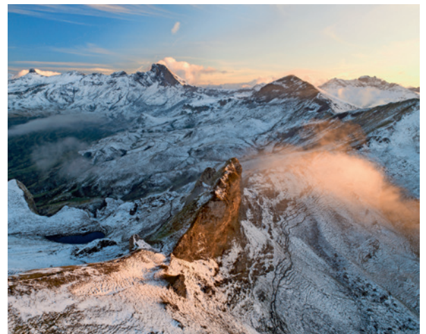
Der erste Schnee, eine Drohnenaufnahme