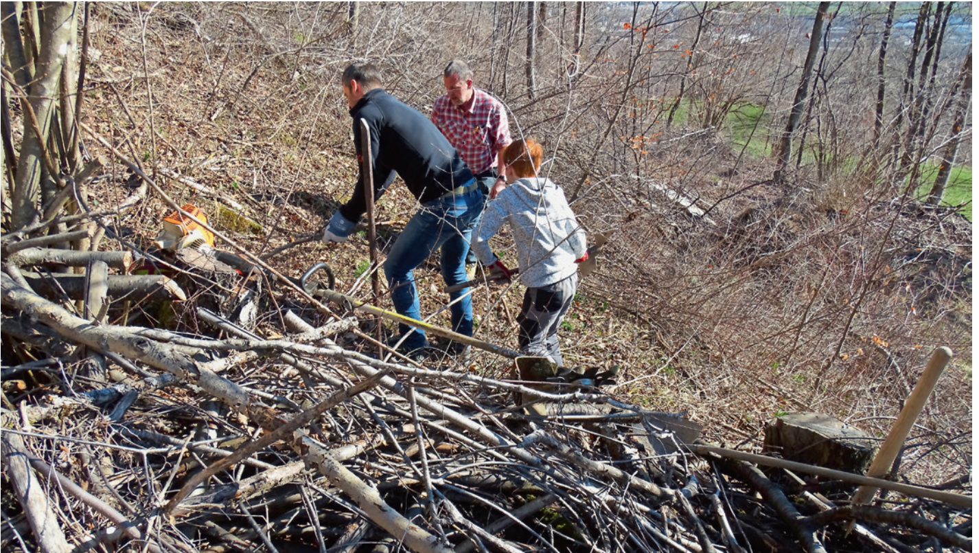
Zuerst muss gerodet werden.

Einst wuchs und gedieh die Edelkastanie im Gebiet Fünf Dörfer prächtig, dann wurden aus ihr Schwellen gebaut. Im Frühling hat der Kulturverein Mastrils damit begonnen, der Cheschtäna zu neuem Aufschwung zu verhelfen: Das kleine Bündner Dorf hat Zuwachs von zwölf jungen Bäumchen bekommen. Und das war erst der Anfang.