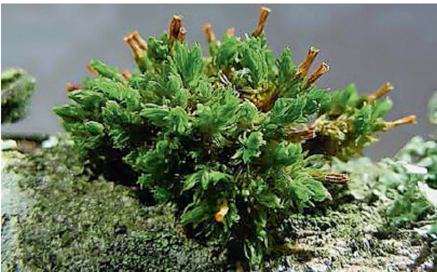
Rogers Goldhaarmoos (Orthotrichum rogeri)

Der Klimawandel ist ein Thema unserer Zeit. Der Wald ist dabei besonders betroffen. Die prognostizierte zunehmende Sommertrockenheit kann den Stress der Bäume erhöhen und sie somit anfälliger gegenüber Schädlingen und Krankheitserregern machen. Umso wichtiger, dass sich der Wald – vielleicht durch forstliche Unterstützung – eine gewisse Klimatoleranz «erarbeitet». Experten sind sich einig: «Der Wald muss umgebaut werden, soll er mit dem Wandel fertig werden.» Die Edelkastanie als einst eingeführte Baumart wurde stets stark forstlich genutzt. Heute gilt sie vor allem als ökonomisch und ökologisch wertvoller Waldbaum. Beim Aufbau klimatoleranter Mischwälder