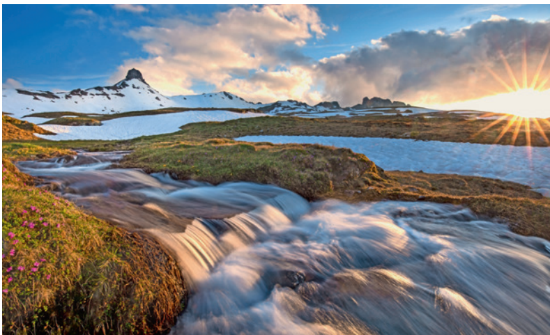
Der Spitzmeilen mit Abendsonne