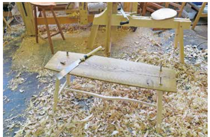
Ein Bänkli, so ähnlich, wie es an der Murger Chilbi erstellt wird.