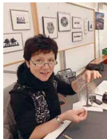
Impressionen aus dem aktiven Vereinsleben: Mitglieder engagieren sich bei der Chilbi.