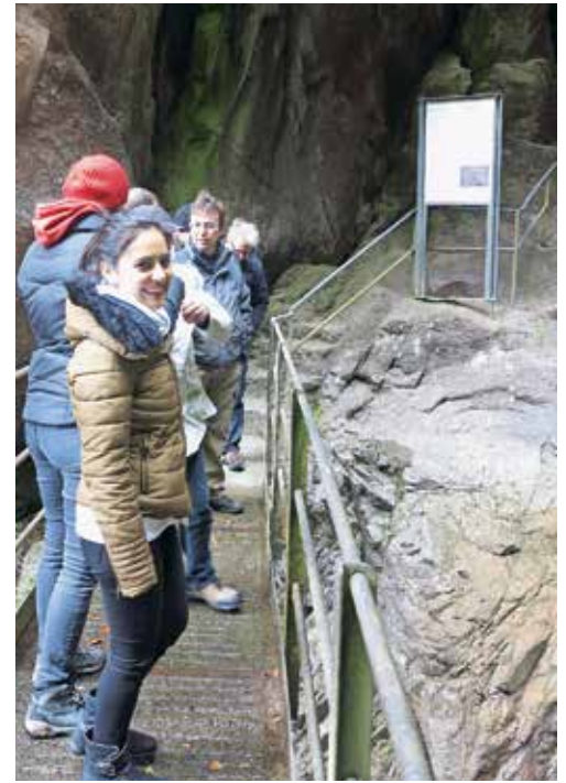
Führungen auf dem Kastanienweg.