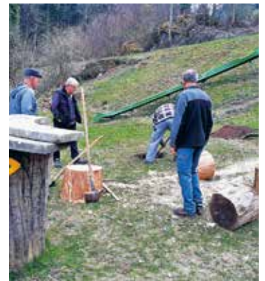
Beim Spielplatz wird eine neue Sitzgelegenheit gebaut.

Auch beim Kastanienweg war Corona sehr zu spüren, es mussten einige Führungen abgesagt werden. Trotzdem wurden sechs Führungen mit rund 90 Personen durchgeführt. Auf der anderen Seite wurde der Kastanienweg von sehr vielen Menschen besucht, die so vermutlich einen Ausgleich zu den aufgezwungenen Covid-Massnahmen suchten. Leider verursachte dieser Besucherstrom auch sehr viel Autoverkehr und dadurch auch ein Parkplatzproblem. Aus diesem Grund wurde von Anwohnern bei der Ortsgemeinde Murg eine Petition eingereicht. Zusammen mit der politischen Gemeinde, der Ortsgemeinde Murg wurden dem Tourismusverein Quarten und Pro Kastanie Murg, diverse Massnahmen erarbeitet, welche umgesetzt wurden.