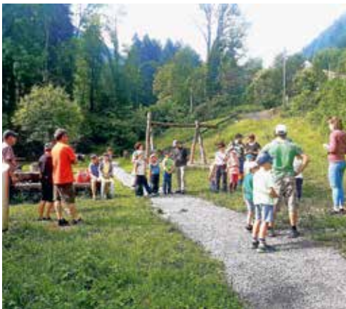
Am Familientag nahmen einige Familien teil.

Am Samstag, 19. Juni, fand der Familientag statt, es war ein voller Erfolg, an dem die teilnehmenden Familien ihren Spass hatten.