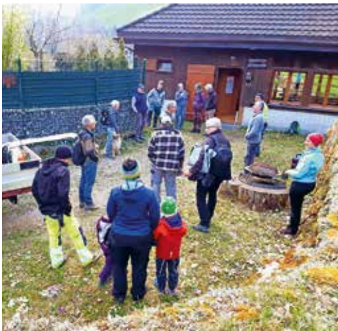
Viele Mitglieder fanden sich für den Arbeitstag ein.

So wurden neben dem Ausflug die Chilbi sowie das beliebte Kastanienessen abgesagt. Die Selvenpflege im letzten September sowie der Arbeitstag von Anfang April 2021 konnten glücklicherweise durchgeführt werden. Am Arbeitstag, welcher am Karsamstag stattfand, kamen erfreulicherweise recht viele Helfer, sodass etliche Arbeiten erledigt werden konnten. Es wurden die Info-Tafel und die Wegweiser geputzt, ein Lattenzaun neu erstellt, ein Geländer ersetzt sowie beim Spielplatz eine neue Sitzgelegenheit gebaut. Ebenfalls wurde im Kastanienstübli der Frühlingssputz gemacht.