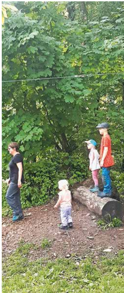
Beim Spiel hatten vor allem die Kinder am Familientag ihren Spass.

Auch beim Kastanienweg war Corona sehr zu spüren, es mussten einige Führungen abgesagt werden. Trotzdem wurden sechs Führungen mit rund 90 Personen durchgeführt. Auf der anderen Seite wurde der Kastanienweg von sehr vielen Menschen besucht, die so vermutlich einen Ausgleich zu den aufgezwungenen Covid-Massnahmen suchten. Leider verursachte dieser Besucherstrom auch sehr viel Autoverkehr und dadurch auch ein Parkplatzproblem. Aus diesem Grund wurde von Anwohnern bei der Ortsgemeinde Murg eine Petition eingereicht. Zusammen mit der politischen Gemeinde, der Ortsgemeinde Murg wurden dem Tourismusverein Quarten und Pro Kastanie Murg, diverse Massnahmen erarbeitet, welche umgesetzt wurden.