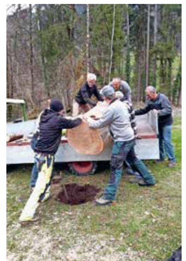
Mit vereinten Kräften wird der Tisch für die neue Sitzgelegenheit abgeladen.

Es ist zu hoffen, dass sich das Ganze wieder normalisiert und wieder ein «normales Jahresprogramm» mit allen, auch den gesellschaftlichen Anlässen, durchgeführt werden kann.